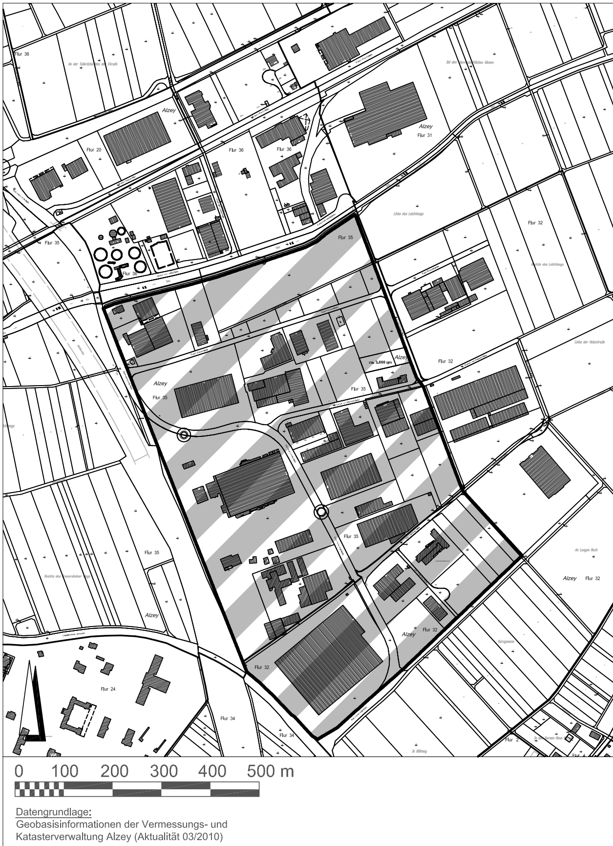
Abbildung 2: Abgrenzung des Ergänzungsstandortes